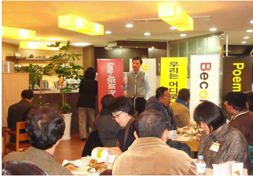
诗人在首尔的咖啡馆呈献诗歌朗读。